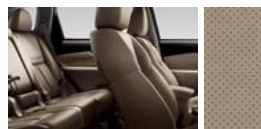
Бежевая кожа с перфорацией