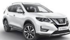
QM1/S — Белый