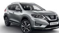
K23/М — Серебристый