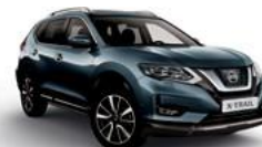
RAQ/М — Синий