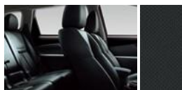
Черная кожа с перфорацией