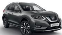
KAD/М — Серый