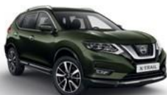
ЕАН/М — Оливковый