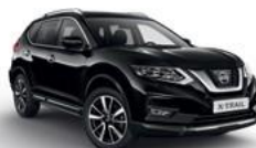
G41/М — Черный