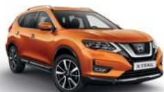
ЕВВ/М — Оранжевый