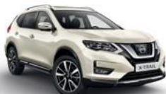
QAB/PM — Белый перламутр