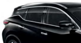
Черный — G41