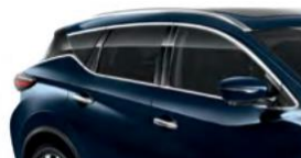
Темно-синий — RBG