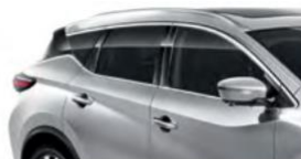
Серебристый — K23