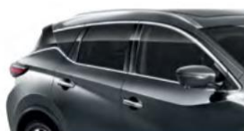
Темно-серый — KAD