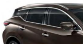
Серо-коричневый — CAM