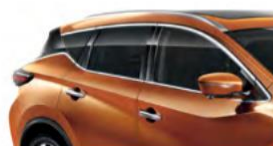
Оранжевый — EAW