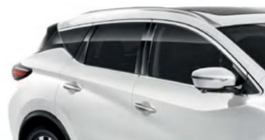
Белый перламутр — QAB