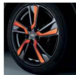
18" легкосплавный Токуо Оранжевый