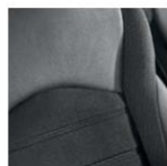
Комбинированная кожа 2 — QE+