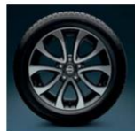
17" легкосплавный Shiro