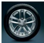
17" легкосплавный Sport