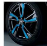
18" легкосплавный Токуо Голубой