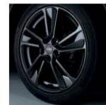
18" легкосплавный Токуо Черный