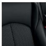
Черная кожа класса «премиум» — LE + Perso