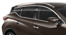
Серо-коричневый — CAM