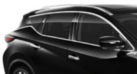
Черный — G41