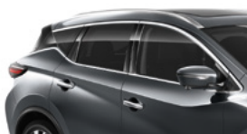
Темно-серый — KAD