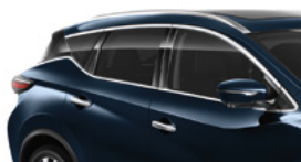
Темно-синий — RBG