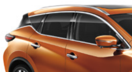
Оранжевый — EAW