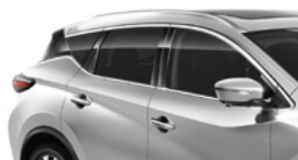
Серебристый — K23