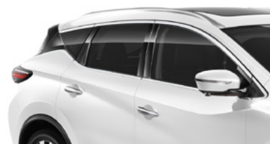
Белый перламутр — QAB